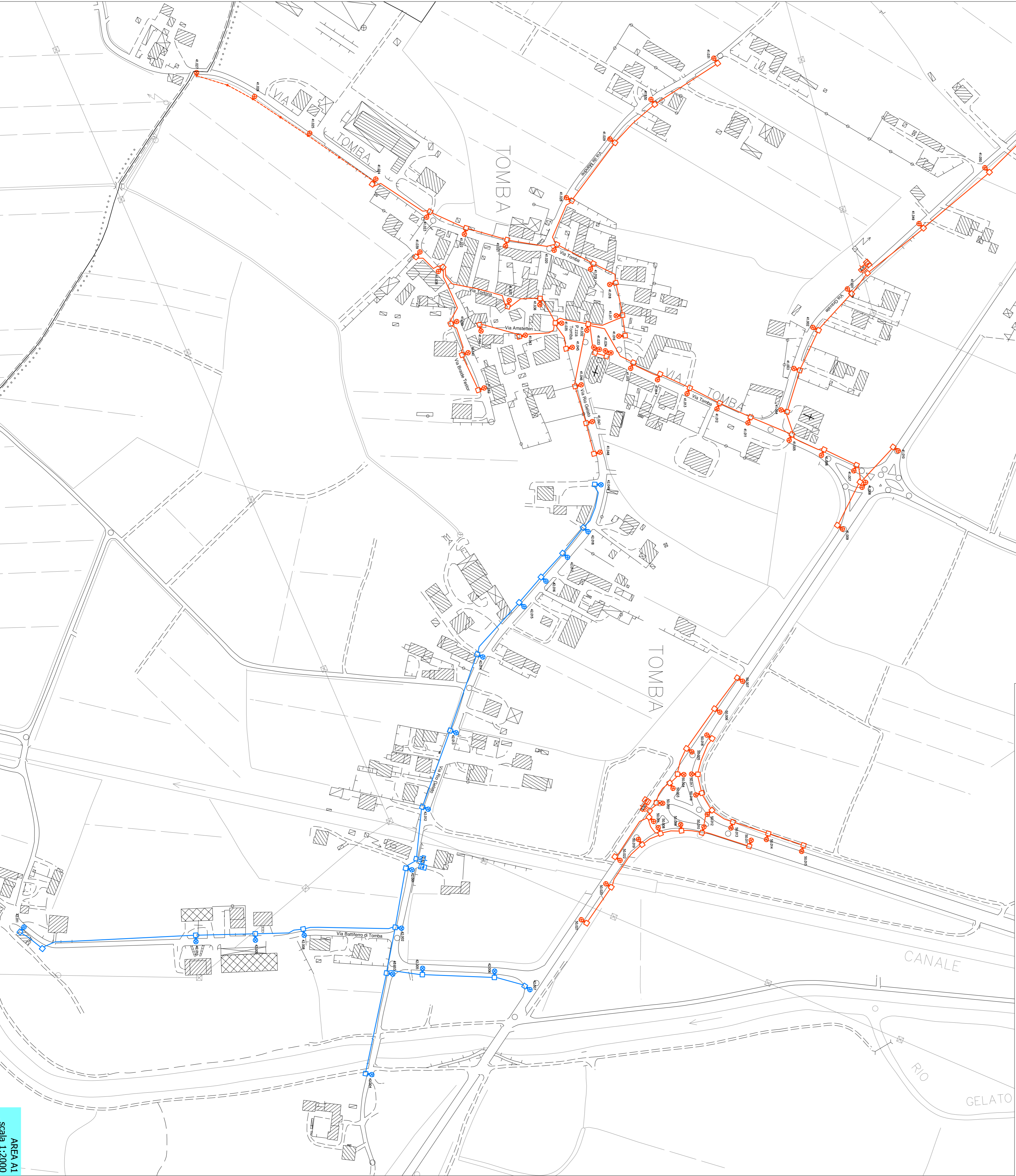
AREA A1 Scala 1:2000